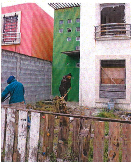
Se limpiaron casas abandonadas y se pidió a los vecinos que denuncien otras en el mismo estado de descuido.

Por su parte el Alcalde Everardo Benavides Villarreal acudió a este arranque en la Colonia Los Encinos y Las Lomas, donde varios camiones retiraron basura y escombros de un domicilio, por lo que aprovechó para dialogar con algunos juarenses para invitar a que cuiden las áreas recién limpiadas y hagan los reportes al número: 80-08-800-808. E