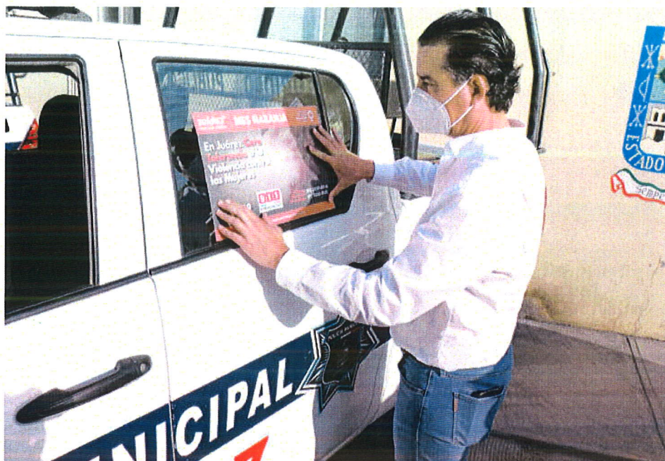
Cada unidad tiene información útil para las mujeres que sufren de violencia.